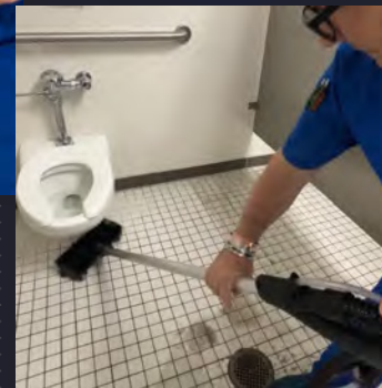
Récupérer les saletés et assécher le plancher