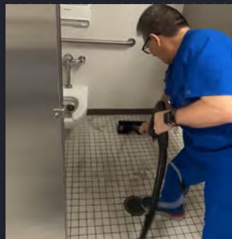
Appliquer la solution et récupérer

UN PLANCHER DE SALLE DE BAIN EN MILIEU DE SANTÉ RÉCEMMENT NETTOYÉ À LA SERPILLIÈRE, NETTOYÉ PAR LA QUICK SCRUB.